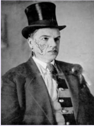
Д.Бурлюк (художник, основоположник російського футуризму)